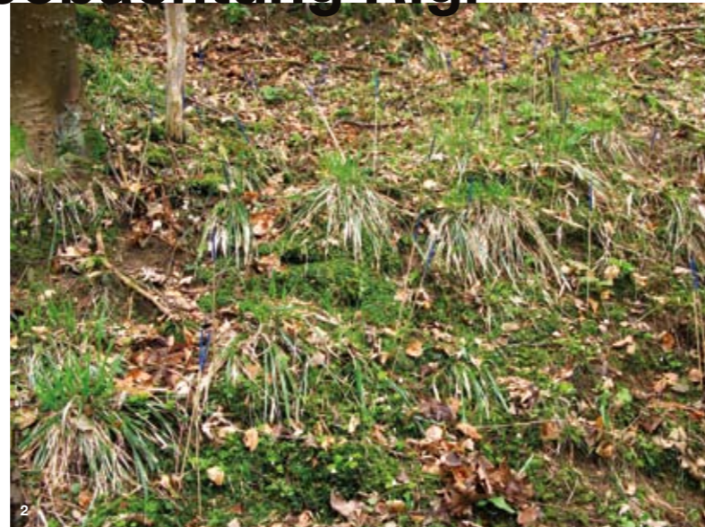
Im Uhrzeigersinn: Ungezünte Fläche 1B, 1996 (Bild 1) und 2009 (Bild 2). Vergleich Entwicklung Anzahl mehrjähriger Weißtannen kleiner (Bild 3) und größer als 10 cm (Bild 4) zwischen 1995 und 2009.

Der Wald an der Rigi-Nordlehne reicht von 460 m ü. M. bis zur Waldgrenze bei ungefähr 1700 m ü. M. Er ist ein wichtiger Schutzwald, da die steile Hangneigung und der instabile Boden an der Rigi immer wieder zu Steinschlag, Felsstürzen, Erdbeben, Wildbächen und Lawinen führen. Insbesondere schützt der Wald der Rigi-Nordlehne neben Siedlungen und Straßen auch die darunter liegende Gotthardlinie der Schweizerischen Bundesbahnen (SBB), die bedeutendste europäische Transitachse durch die Alpen von Norden nach Süden.