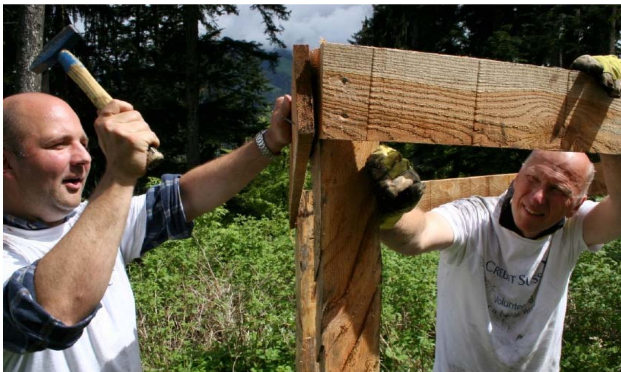
Wildschutzmassnahmen bei einem Corporate Volunteering Einsatz der Credit Suisse im Bergwald von Chur, Kt. Graubünden.

Die verschiedenen Projekte des Bergwaldprojektes stellen sich im Jahr 2010 folgendermassen dar: Es haben 47 (45) Bergwaldprojekt-Wochen, welche den ursprünglichen wöchentlichen Einsätzen mit Erwachsenen entsprechen, stattgefunden. Vermehrt wurden Projekte mit Schulklassen und Lehrlingen durchgeführt, namentlich 23 (18) Einsatzwochen. Stabil blieb das Engagement mit Firmen und Organisationen im Rahmen von so genannten Corporate Volunteering-Einsätzen. Es haben 46 (47) Tage stattgefunden, davon wurden 38 von Mitarbeitenden der Credit Suisse Bank geleistet. Ebenfalls wurden 2010 wieder ein Handholzerkurs, drei Projektwochen für Familien sowie eine Ausbildungswoche für Gruppenleitende durchgeführt.