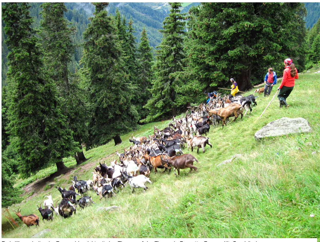
Freiwillige arbeiten im Bergwaldprojekt mit den Ziegen auf der Ziegenalp Puzetta, Fuorns, Kt. Graubünden.

Das Bergwaldprojekt hat zum ersten Mal mit Freiwilligen eine Ziegenalp betrieben. Dieser Einsatz auf der Alp Puzetta in der Gemeinde Medel/Lucmagn trägt dem Umstand Rechnung, dass im Alpenraum die Waldfläche zunimmt und wertvolle Naturräume auf dramatische Art und Weise verloren gehen. Gemäss aktuellem Landesforstinventar hat sich das Waldareal der Schweiz in den letzten 11 Jahren um fast 600 Quadratkilometer ausgedehnt! Das Projekt Puzetta wurde als Pilotprojekt in Zusammenarbeit mit der Alpkorporation und dem Forstdienst durchgeführt. Anstatt Arbeiten zur Landschaftspflege auszuführen, wurde die ursprüngliche Ziegenwirtschaft durch die Arbeit der Teilnehmenden unterstützt. Das Bergwaldprojekt setzt hier ein mutiges Zeichen zugunsten der Biodiversität der alpinen Landschaft und nicht zuletzt zugunsten der Regionalwirtschaft im Berggebiet. Das grosse Echo nach den 16 Einsatzwochen der ersten Durchführung ermutigt zur Fortführung des Projektes.