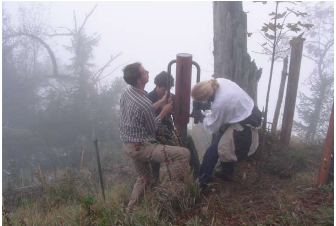
Erfolgreiche Bergwaldprojekt-Schnuppertage: Zaunbau in Malans 2007

Am 19. Januar 2007 ist in Innsbruck zum ersten Mal der «Alpine Schutzwaldpreis» für herausragende Leistungen zur Erhaltung und Verbesserung des Schutzwaldes im Alpenraum verliehen worden. In der Kategorie «Schutzwaldpartnerschaften» ist die Stiftung Bergwaldprojekt ausgezeichnet worden.