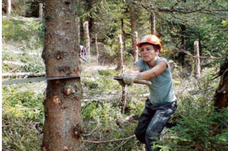
Frauenpower mit der Handsäge: Forst-Verjüngung in Engi 2007

Während dem Projekteinsatz im Kanton Uri wurden Parlamentarier aus den Bergkantonen eingeladen, sich einen Tag mit den Zusammenhängen des Bergwaldes auseinander zu setzen.